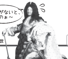
ゲスト:国王ルイ14世